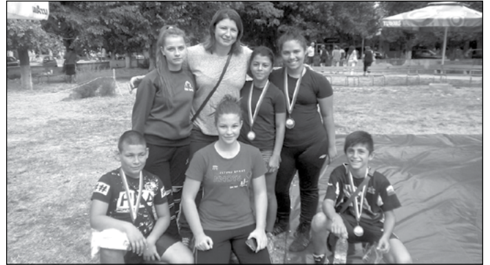
Нашите състезатели се снимаха за спомен със световната шампионка по борба Станка Златева