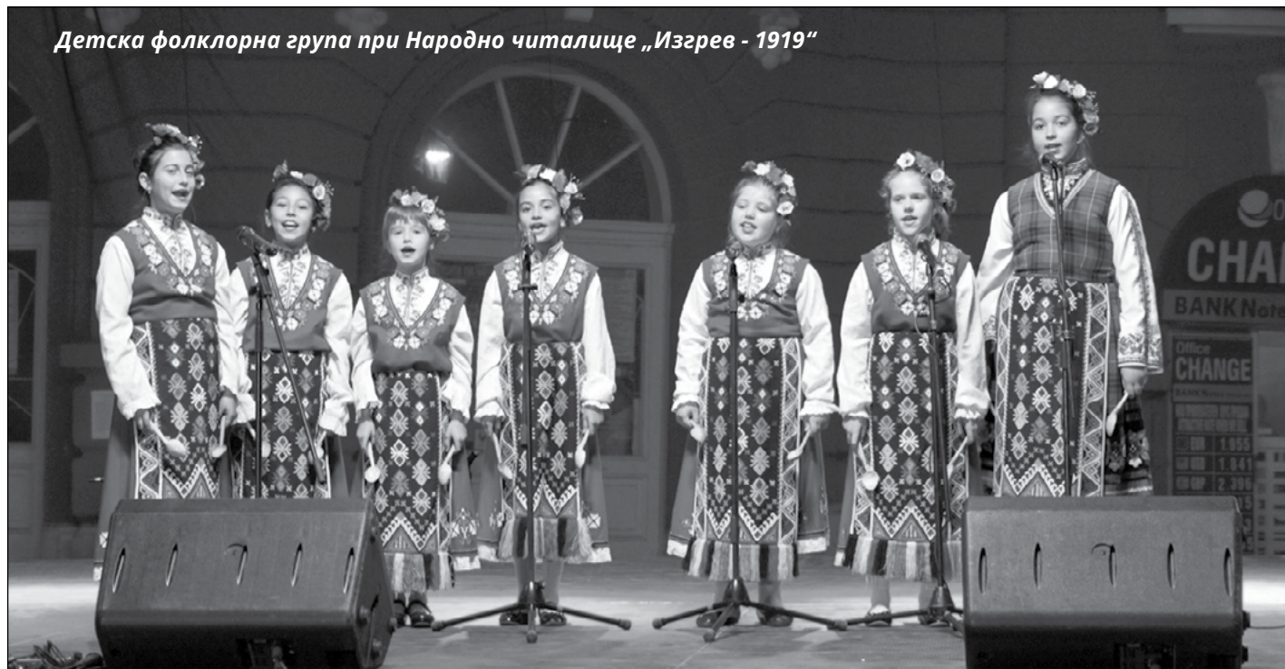
Детска фолклорна група при Народно читалище „Изгрев - 1919“